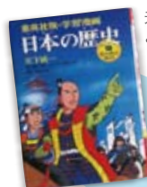
夫の小学生時代の歴史マンガ。 よくとっておいだな～

『江』や昨年の『龍馬伝』を観るにつけ、本当に多くの血が流されて今の日本があるんだなあとしみじみ感じます。その裏には数々のドラマや想いがあって。「歴史は暗記」だった私ですが、こうやって年表の裏側を見たほうが格段に知識はつきますね!!子供におすすめです。