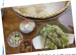
そうめん 1人前 650円