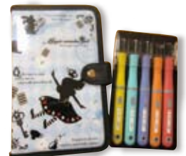
娘の選んだケース& 今どきの彫刻刀