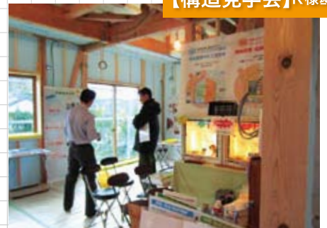
2月に完成見学会予定です!是非お越しくださいね!!