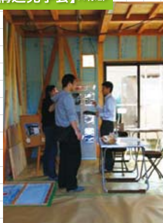
すでに完成しお住まいになっています。これから完成見学会をする予定です!