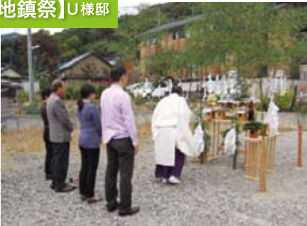
初夏の完成予定です。もちろん長期優良住宅!