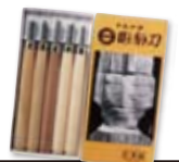
昔からの彫刻刀、 これでしたよね??