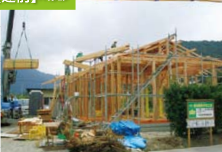
午後からあいにくの雨でしたが、無事上棟!