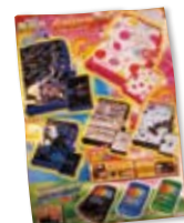
彫刻刀の申込書だと 分かります?

セットも書道セットも種類が多くかわいかった。来年は裁縫セットを購入することになるのですが、一体どんなのが出てくるんでしょうか?