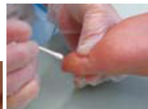
液体窒素治療中。 痛いけどじっと我慢

今現在6回治療しました。3つに増殖したんですがだいぶ小さくなっています。しかし、皮膚疾患は素人には判別が難しいですよ。ひと目で判断のつくお医者さんってやっぱりすごい!!(当たり前?)