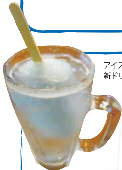
アイスのガリガリ君をサワーに入れた新ドリンクメニュー。斬新です!!