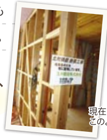
現在建築中のK様邸、このように周知徹底します。

地域材の利用は森林の保全、地球温暖化の防止に貢献し、地域の振興にもつながります。 この機会に地球に優しい家づくりを考えてみませんか？