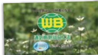
長野朝日放送の「地球を守ろうプロジェクト」